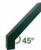
Bayoneta con ángulo de 45°