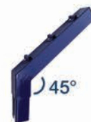
Bayoneta con ángulo de 45°